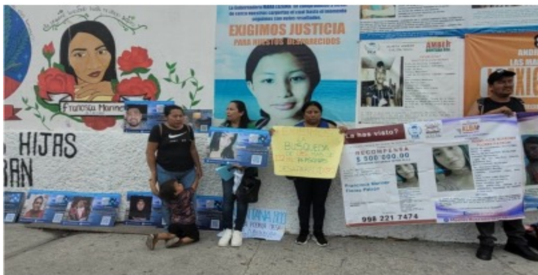
Activistas de Quintana Roo se unen a movimiento nacional para buscar a desaparecidos

- Los colectivos “Verdad, Memoria y Justicia”, “Madres Buscadoras de Quintana Roo” y otras buscadoras independientes, algunas de las cuales llevan años intentando encontrar a sus hijos, convocaron a todas las asociaciones civiles así como grupos de diversa índole para que todos se organicen a fin de rastrear a sus desaparecidos en todo México.